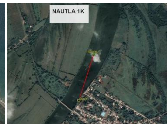
Ruta 1k Nocturno Y Día