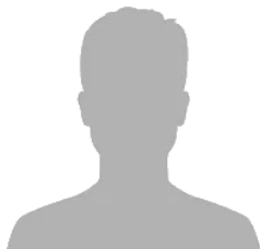
Nombre Equipo Atleta / Entrenador / Delegado