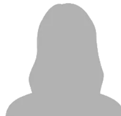
Nombre Equipo Atleta / Entrenadora / Delegada

Las Fotos y Videos detrás de los Bloques de Salida, Vestidores y/o Baños, está terminantemente prohibido